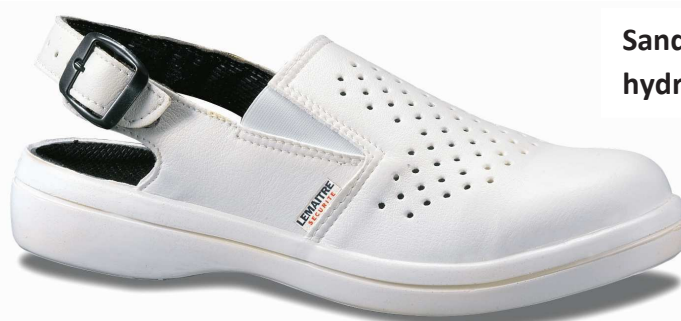
Sandale en micro fibre blanche hydrofuge

DATE DE MISE A JOUR de ce document : 01/06/2010 Référence ISO de ce document : DON/LS 03.848.C